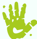
Foto machen oder PDF Ihres Formulars hochladen. Unsere KI erkennt automatisch auszufüllende Felder.

Felder kontrollieren und anpassen. Zur Wahl stehen Textfelder, Auswahlfelder und Unterschriftenfelder.